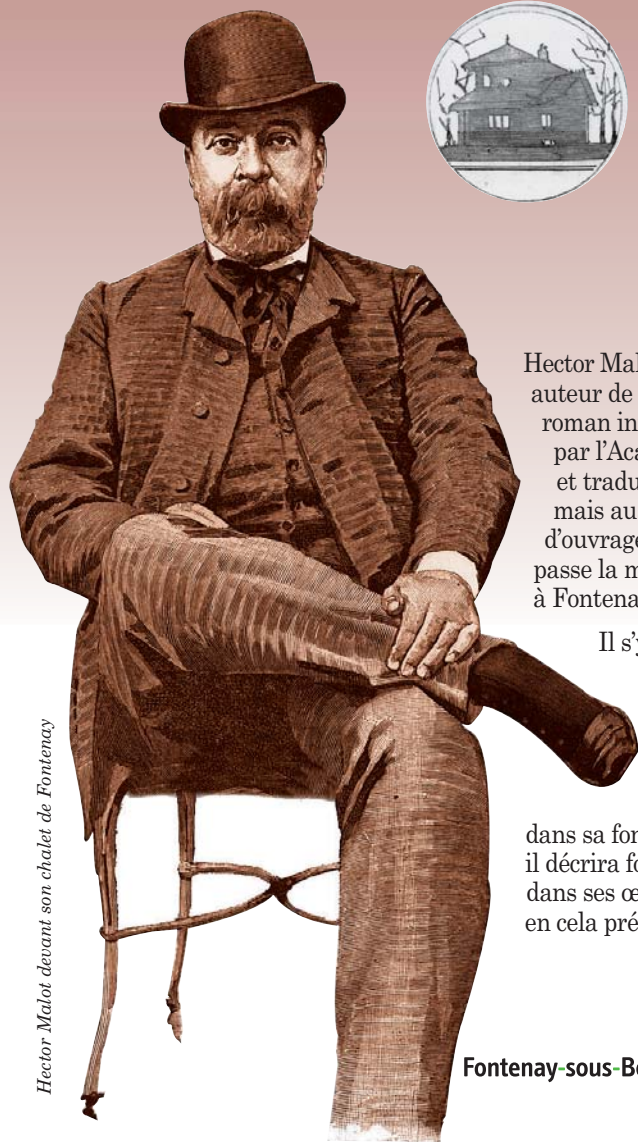
Hector Malot devant son chalet de Fontenay

Hector Malot, auteur de Sans Famille (1878), roman initiatique primé par l'Académie française et traduit dans le monde entier, mais aussi d'une soixantaine d'ouvrages pour adultes, passe la majeure partie de sa vie à Fontenay-sous-Bois.