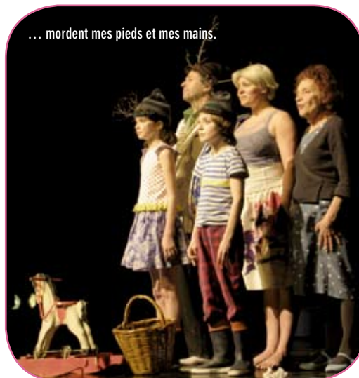
... mordent mes pieds et mes mains.