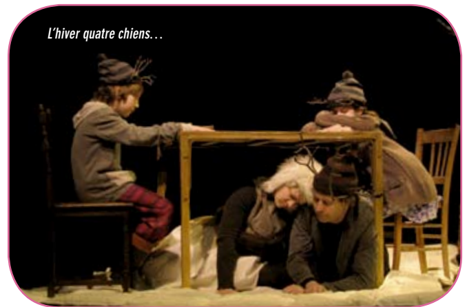
L'hiver quatre chiens...

La compagnie est en résidence à Fontenay depuis 2003. Pour une troupe, être en résidence est un soutien, une reconnaissance. Et un engagement: la compagnie travaille toute l'année avec les écoliers de Fontenay et leurs enseignants. Dix classes, du CM1 à la 6 e , invitées à la lecture du théâtre contemporain. « Les