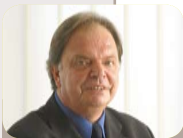
Jean-François Voguet Sénateur-Maire

Pour y contribuer, la municipalité de Fontenay, comme d'autres villes, a décidé d'ouvrir ce débat aux citoyens ainsi qu'à tous les acteurs de la communauté éducative.